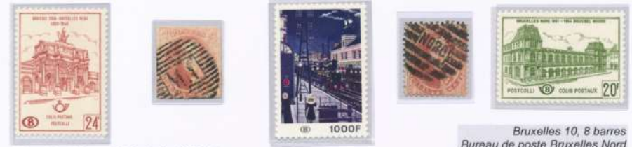
Bruxelles - Namur MI Ambulant Midi 1

Suite au blocus de l'Escaut par les Néerlandais, les activités du port d'Anvers étaient minimes. Léopold I er fit pression sur le Gouvernement pour créer en 1834 la Société des Chemins de Fer Belge. Bruxelles sera la première capitale au monde à être desservie par un train.