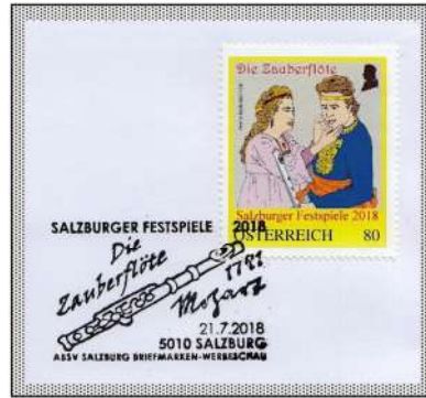
Tamino mein! Oh Welch ein Glück , Act 2 Scene 28