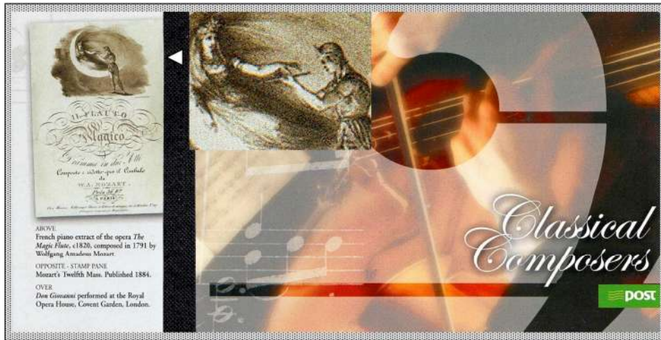
O zittre nicht, mein lieber Sohn, Act 1 Scene 6 : No. 4

Prince Tamino receives the magic flute from the Queen of the Night to pass the trials and finding princess Pamina.