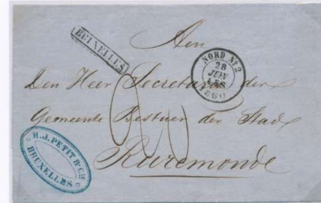
"Nord N°2" (Bruxelles - Anvers). Suivant la convention postale bilatérale avec les Pays-Bas du 17.12.1851, l'affranchissement avec timbre-poste était facultatif. Tarif jusqu'à 15 gr - 40 centimes(Belge) soit 20 cent Pays-Bas.

5 mai 1835, la ligne Bruxelles - Malines est inaugurée et rapidement prolongée vers Anvers. C'était la première ligne commerciale du continent. En 1843, 556 kms de lignes existaient, les liaisons "Nord - Sud" et "Est - Ouest" étaient en service. Les liaisons rapides entre Bruxelles et Anvers ainsi que les centres industriels étaient réalisés et prolongés vers l'arrière-pays. Le matériel et l'infrastructure évoluaient rapidement.