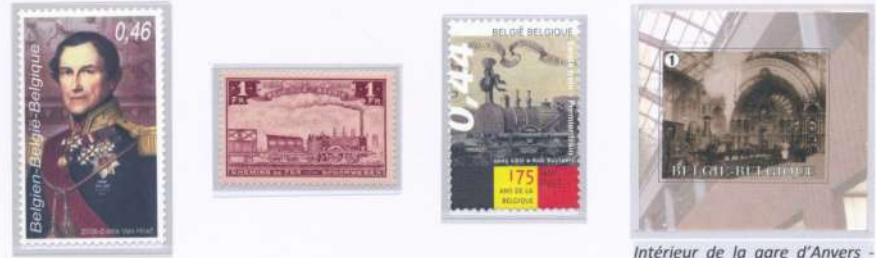
Intérieur de la gare d'Anvers - Partie timbre d'un entier.

Suite au blocus de l'Escaut par les Néerlandais, les activités du port d'Anvers étaient minimes. Léopold I er fit pression sur le Gouvernement pour créer en 1834 la Société des Chemins de Fer Belge. Bruxelles sera la première capitale au monde à être desservie par un train.